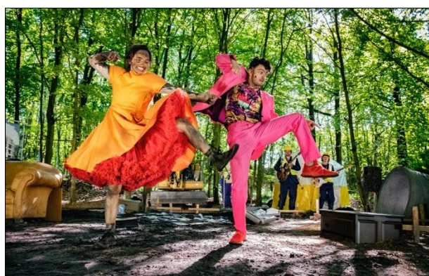
Scènefoto Hier valt niets te halen (2022)