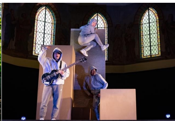
Scènefoto TERECHT (2023)