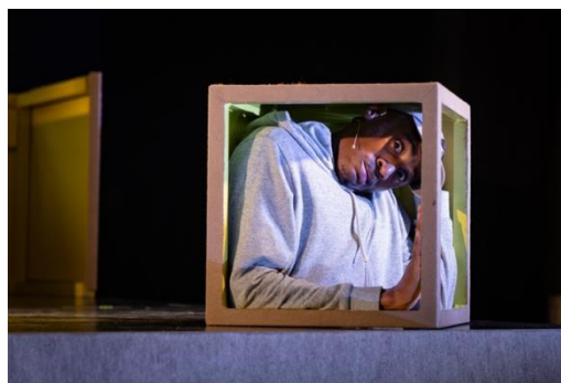
Scènefoto TERECHT (2023)

De voorstellingen van Wabi Sabi zijn ook toegankelijk en relevant voor nieuwe publieksgroepen, waaronder scholieren, studenten en mensen die professioneel of vanuit eigen ervaring betrokken zijn bij de problematiek. Zo speelde Hier valt niets te halen voor duizend studenten van de Hanzehogeschool in Groningen en voor gemeentelijke instanties. Met de gemeente werd een nagesprek in de wijk georganiseerd waarbij zowel ervaringsdeskundigen als beleidsmakers aanwezig waren. TERECHT wordt in 2024 getoond aan medewerkers van de reclassering, de GGZ, zorg- en veiligheidshuizen, en aan middelbare scholieren en studenten van relevante studierichtingen.