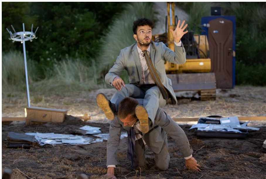
Scènefoto Hier valt niets te halen (2022)